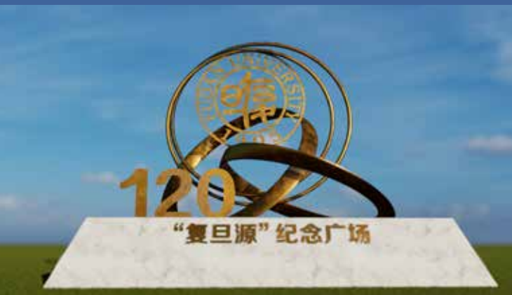
“复旦源”纪念广场主体造型示意图