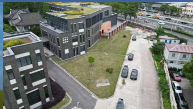
拟选址一：艺术馆后三角地