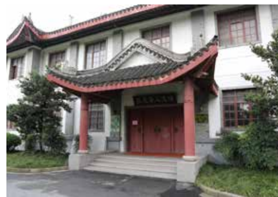
300号景莱堂(蔡冠深人文馆)现貌