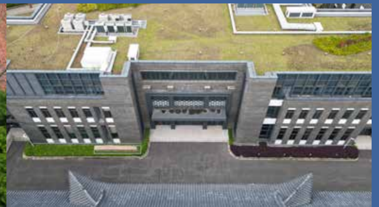
拟选址三：新校史馆/科技成果展示馆前