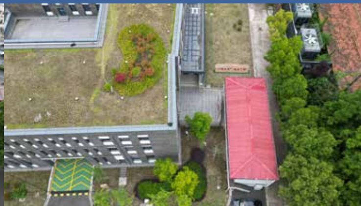
拟选址二：地铁出口左侧